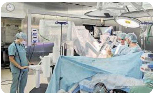
Krebszentrum am Leopoldina: Interdisziplinäre Spitzenmedizin für bestmögliche Versorgung.

Prostatakrebs kann in den frühen Stadien oft symptomlos verlaufen, was die Früherkennung schwierig macht. Zu den im weiteren Verlauf möglicherweise auftretenden Symptomen gehören Probleme beim Wasserlassen, Blut im Urin, Schmerzen im Hüft- oder Beckenbereich oder eine sexuelle Dysfunktion. Dank des medizinischen Fortschritts haben Erkrankte jedoch eine gute Heilungsprognose, insbesondere wenn der Tumor frühzeitig erkannt wird.